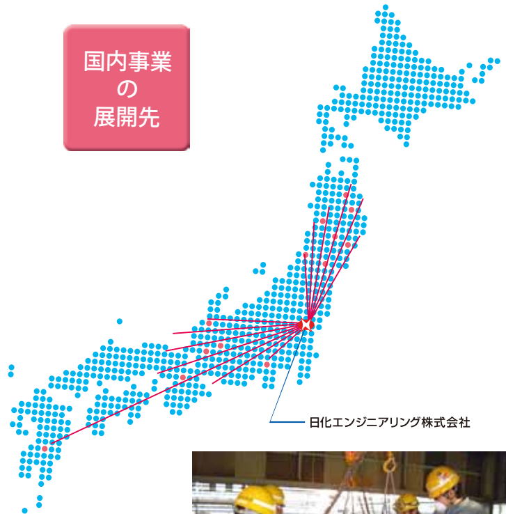
— 日化エンジニアリング株式会社